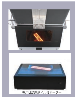
専用LED透過イルミネーター

専用LED透過イルミネーターをご用意しています。 専用LED透過イルミネーターをセットすれば、危険なUV光からの脱却が出来ます。 LED励起光で、EtBrでもGreen系色素でも撮影・切り出しが可能です。